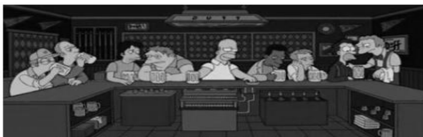
Crédito: < http://blogna.tv/a-ultima-ceia-na-tv/ >. Acesso em 22 out. 2011.

QUESTÃO 16: De que forma se dá a intertextualidade estabelecida entre as duas obras?