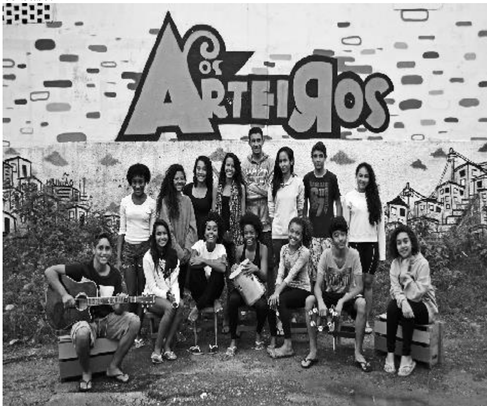
Os Artelhos. Grupo Cultural da Cidade de Deus - RJ