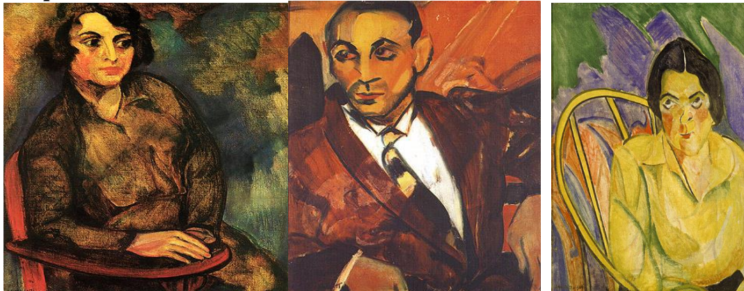
A estudante russa (1915), O homem amarelo (1915-16), A Boba (1915-1916) Obras de Anita Malfatti.

QUESTÃO 02. Comente de que maneira as obras da artista Anita Malfatti, expostas em 1917, criticadas por Monteiro Lobato, influenciaram a Semana de Arte Moderna?