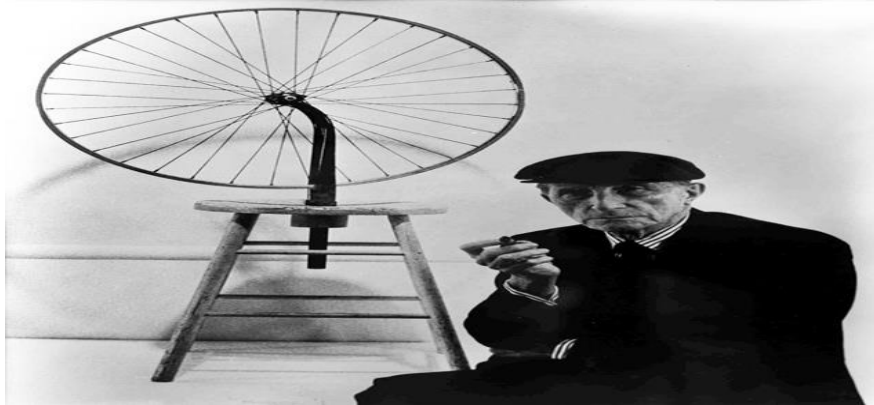
Marcel Duchamp, 1887 – 1968, Blainville-Crevon, França

QUESTÃO 01. Identifique a vanguarda artística representada na obra em análise.