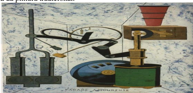
Dadaísmo.9Desfile Amoroso. Francis Picabia, 1917

Francis Picabia (1879-1953), pintor e escritor francês envolvido com os princípios do Dadaísmo, colaborou com Tristan Tzara na revista Dada. O quadro acima de sua autoria remete ao movimento por ser uma crítica à forma da pintura tradicional.