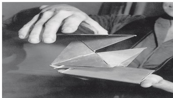
Bicho de bolso, Lygia Clark 1966