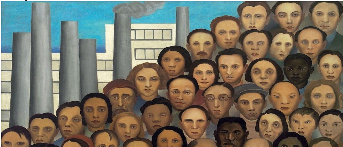
Os operários- Tarsila do Amaral-1933- Coleção particular, São Paulo, Brasil

QUESTÃO 05. Aponte as características da pintura de Tarsila do Amaral e de que maneira sua temática representa a realidade atual da sociedade brasileira