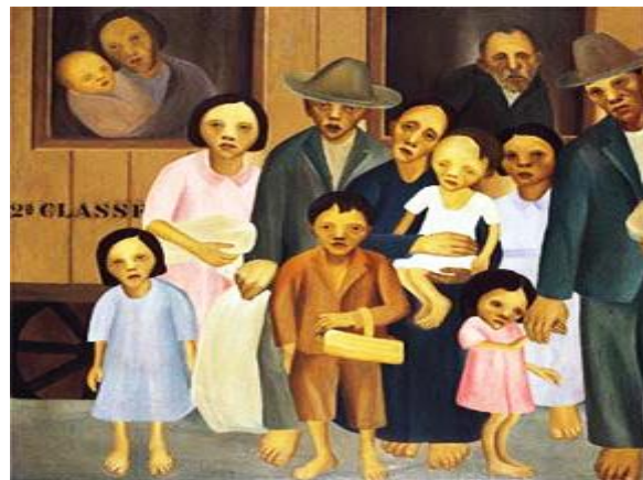
Segunda Classe- Tarsila do Amaral 1933- Coleção particular, São Paulo, Brasil

QUESTÃO 05. Aponte as características da pintura de Tarsila do Amaral e de que maneira sua temática representa a realidade atual da sociedade brasileira