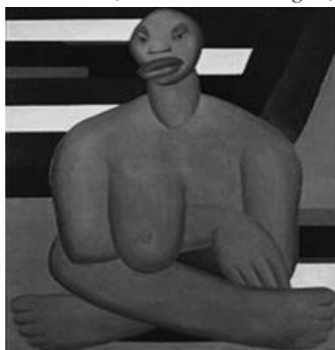
Imagem 2 – AMARAL, Tarsila do. Antropofagia , 1929.

Imagem 1 – AMARAL, Tarsila do. A negra , 1923.