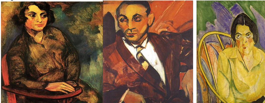
A estudante russa (1915), O homem amarelo (1915-16), A Boba (1915-1916) Obras de Anita Malfatti.